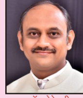
ऑन.सेक्रेटरी रो. अंड. हेमंत भंगाळे